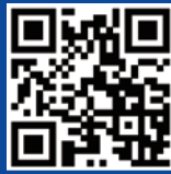
INU 대표페이지 (Homepage)