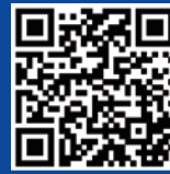
INU 공식유튜브 (Youtube)